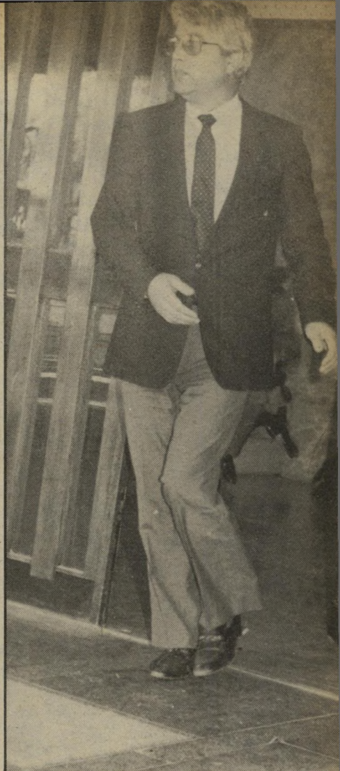
לוי: בתנופה חלקה ואלגנטית