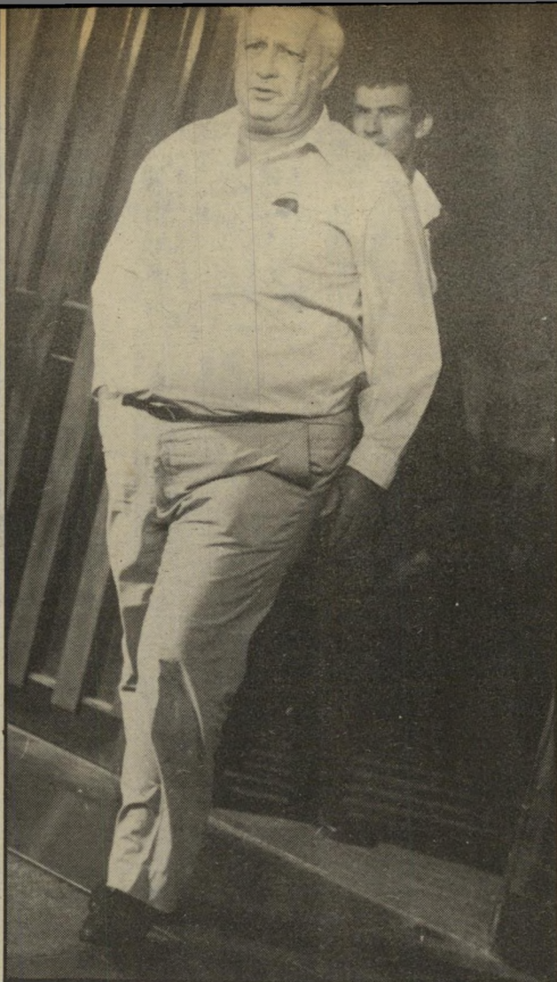
שרון: רחפור כבד וזועם