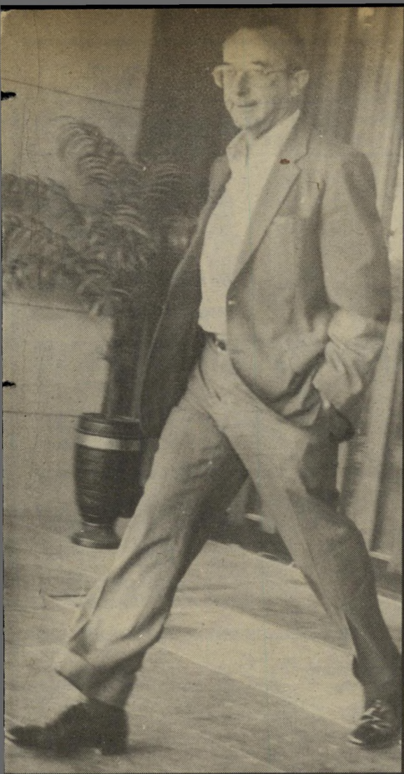
ארנס: אלגנטיות קלילה וספורטאית