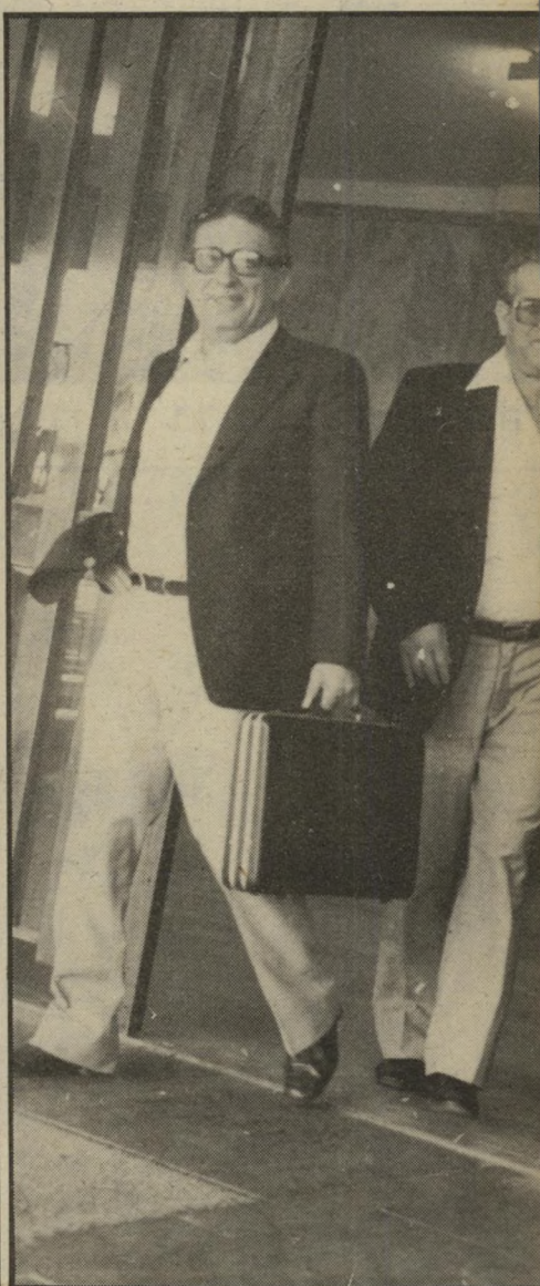
קורפו: חשיבות ותיק גיימס בונד