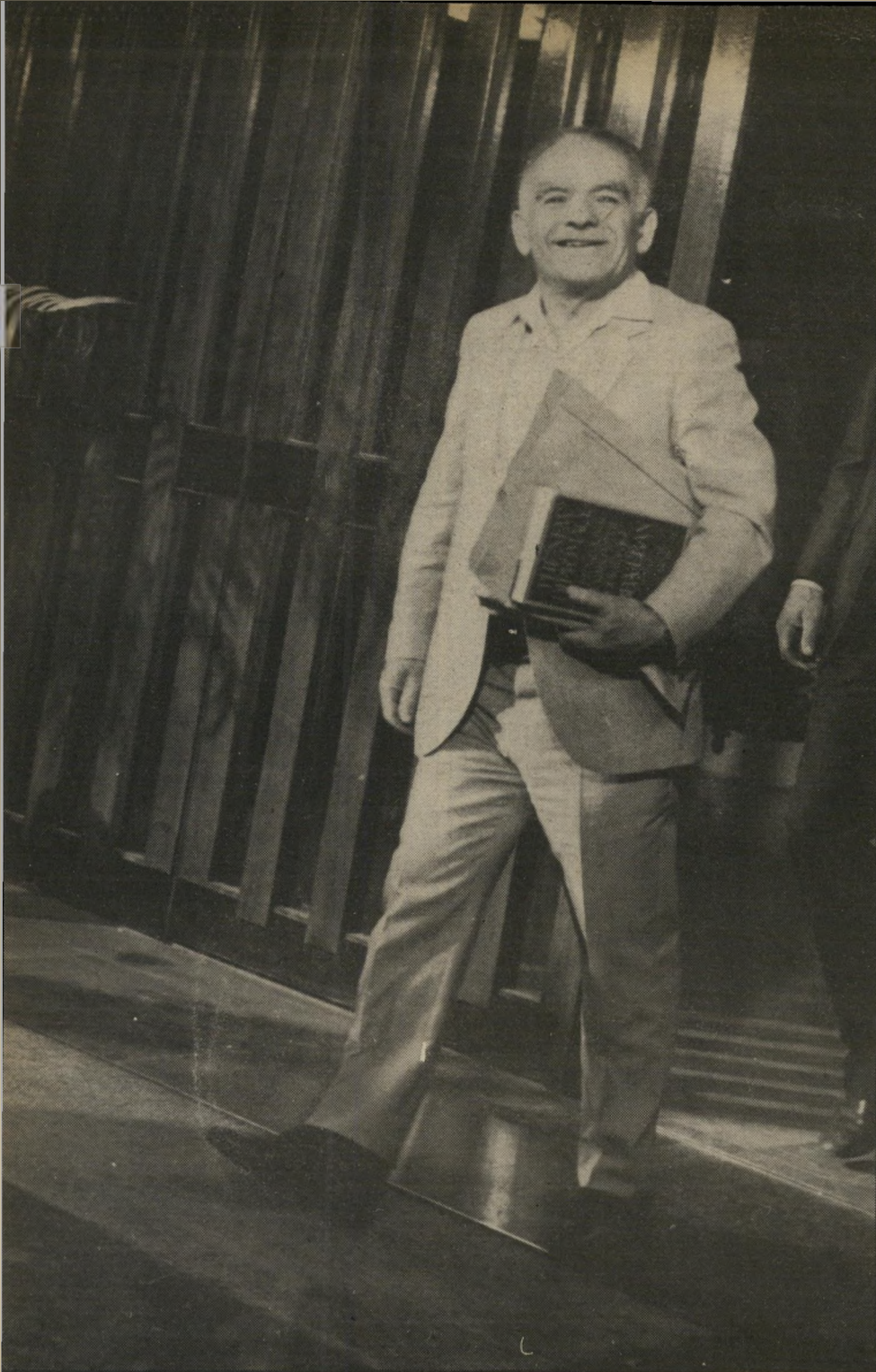
שמיר: חיוך רחב וספר של אבא אבן על „הדיפלומטיה החדשה“

כאותו הזמן כבר מתחילים להגיע הצלמים והכתבים. הם מסתדרים בשורה מאחורי החבל וממתנים לשרים.