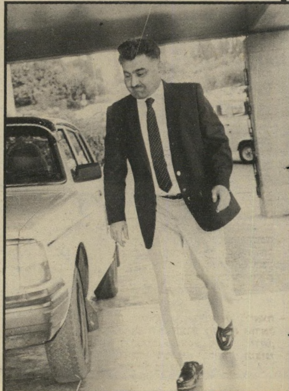
נסים: בלייזר ומכנסיים בהירים