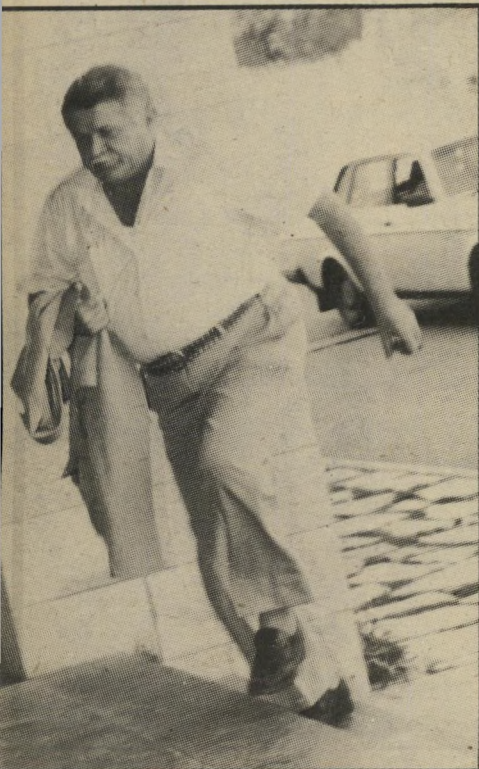
גרופר: בכבודות, המיקטורן ביד