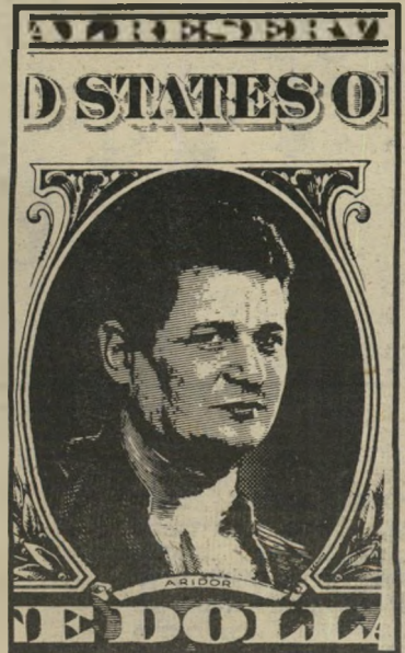
אריוור * די עם כחול-לבן!

כך גם לגבי הרכוני העולמי. רשות שרות תבל מוכנה להיות לעזר בעניין זה. אפשר גם להנהיג חוקה אחת לבריות, ההכרזה העולמית של זכויות האדם, ודי עם הכחול-הלבן!