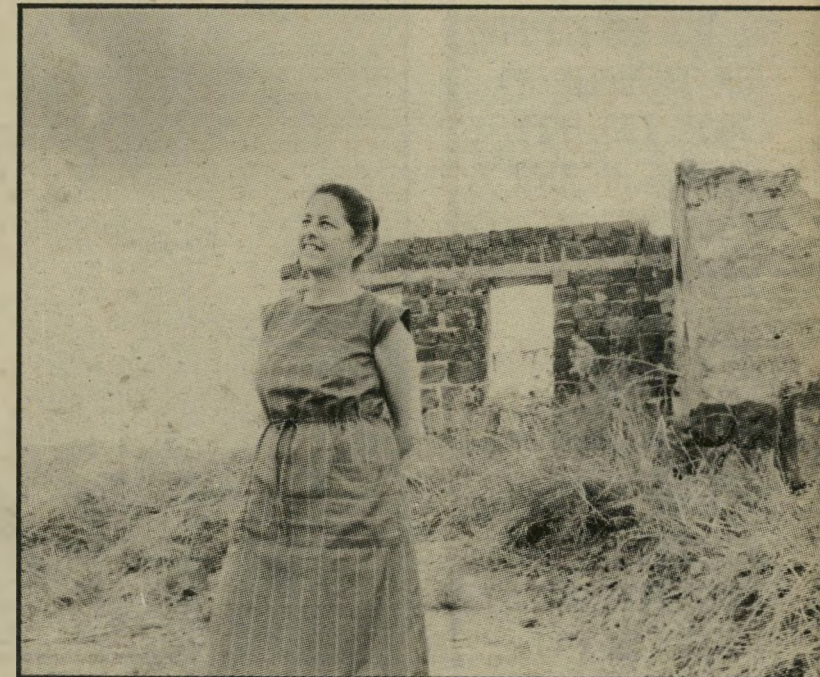
סולודר ליד חדר-האוכל של גשר הישנה גדלתי על גדת הירדן...

שלא ממלא את החובות האלה, נותנים לו להרגיש