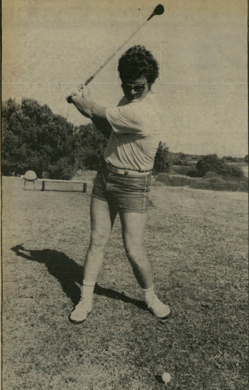
גולפאית קורקואה בושם ואפטר-שייב