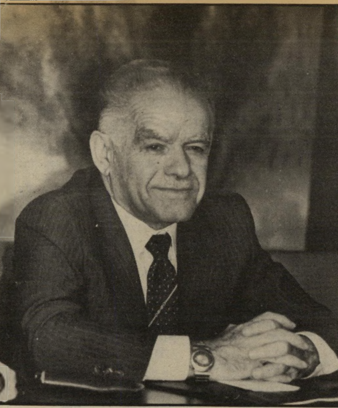
ראש-משלה שמיר בקרן-רכבת גדוש חיטים

משוה אחר. בטח שהייתי רוצה צעירים, כמו שהגברים רוצים צעירות. גבר צעיר הוא לבטח יותר אסתטי ונחמד. אני חושבת שאין דבר יותר יפה מגבר יפה עם גוף יפה, בלי כרס. עכשיו יש פירסומת של סבירנה או משוה. תענוג להסתכל על זה. הגברים בגילנו לא מטפחים את עצמם. הם חושבים שהם לא צריכים, אבל זה צריך להיות ההיפך. זה הכל מראה על האגו שלו. הוא חושב שהוא כלי-כך מושלם שהוא לא צריך שום דבר. אני חושבת שאם גבר הוא אסתטי ומתבטח, זה יופי. הרי רובם מטייחים, אז אני צריכה עוד לשבת על ידם? לא!