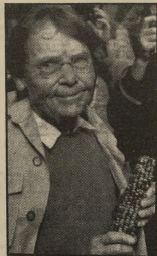
ד"ר מקלינטוק גרעינים כחים או בהירים

נותחה ♦ בלונדון, בפעם השניה תוך 15 חודשים, להסרת גידול סרטני, שחנקית הקולנוע הבריטית, פצצת-המין דייאנה דורס (44).