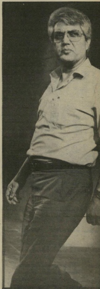
מועמד לוי מירצה לסדר אותם

ההגדרה הזאת הצחיקה את ח"כ מיכאל קליינר, מראשי קבוצת לוי בתנועת החרות. קליינר אמר מפור שות להעולם הזה, שהתוכנית לשלוח את לוי לטפל בירושת יורם ארידור היא מדימה של ח"כ רונן מילוא.