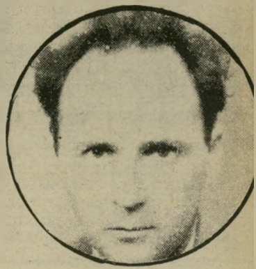
סופר זרחי נכס יתרבות נשכח

סיפורי ישראל זרחי, תחת הכותרת ילקוט זיפורים. קובץ זה, שפורסם בהוצאת יחזיון שיתוף עם אגודתהסופרים, מציג אך מעט וכוחו הספרותי של סופר מוכשר זה. שמת בגיל עיר יחסית.