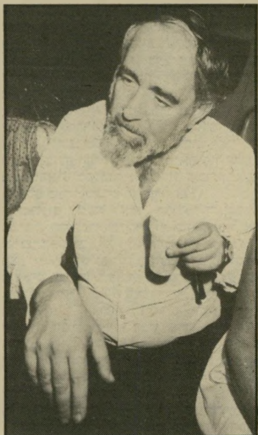
משורר זק הגיע הזמן לשיר הנכון

חלק ניכר מהטפילים הביקורתיים הניזונים מדמם של יוצרים בתרבות הישראלית, ממומנים כירי הציבור הרחב במשכורת אקדמית + שנת' שכתון. אחד מהבולטים בטפילי הביקורת, הוא