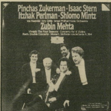
מנצח מהטה ושוח' — התפלאו על ההזמנה

משתפת־הפעולה האחרונה עם מינגוס הגדול הייתה הזמרת והמלחינה האמריקאית ג'וני מיטשל. הוא כתב למענה שישה להנים. בקשתו הייתה כי תכתוב להם תמלילים, וכי יקליטו אותם יחדיו. סיפרה מיטשל: "כפעם הראשונה שראיתי את פניו, חייד אלי בשוככות עליוה. חיבבתי אותו מייד. הגעתי לניו־יורק, כדי להאזין לשישה שירים חדשים, שכתב עבורי. זה היה לי לכבוד! הייתי מסוקרנת! זה כאילו שעמתי על שפת נהר — בוהן אחת במים, נורקת אותם — וצ'ארלי הגיע ורחף אותי פנימה — 'טטבעי או תשחי'. הוא צוחק למראה השחיה הכושלת שלי במימי המוסיקה הקלאסית השחורה..."