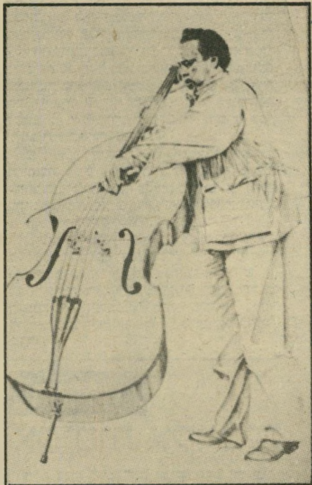
מוסיקאי ג'אז מינגוס טטבעי או תשחי

● תקליטו האחרון של צביקה פיק, אוסף פרטי, כולל קטע בשם שיר לגון לנון. זהו ניסיון רוחה של פיק ואשתו, כותבת התמליל, להגיב ולהביע צער על רציחת היוצר האנגלי הגדול, חבר החיפושיות לשעבר. גם ללא השוואה לשירים היפהיים שכתבו לזכר לנון מוסיקאים כמו פול סימון, ג'ורג' האריסון ואלטון ג'ון, נכשל שירו של פיק ככל: חוסר רגישות, אווירת "סאהב" בינלאומית עם "ג'וני", שאין לה מקום, שהיא יומרנית ופוגעת בטעם הטוב, ועם לחן קופצני ללא קשר לתוכן התמליל. גם לתוכן עצמו, אגב, אין קשר לאמומה.