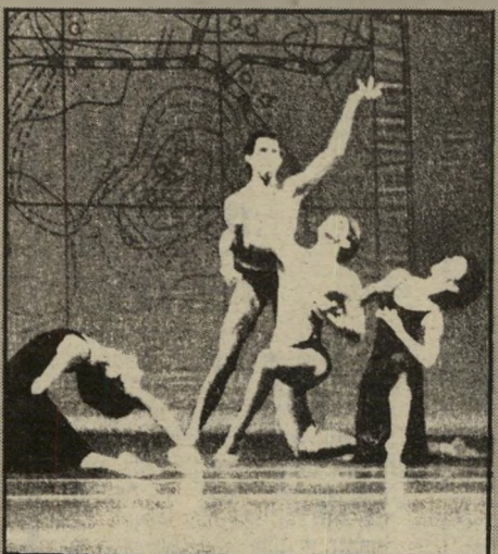
בת-דור במעולה. הישג בארצות-הברית

עתה הגיע תורה של להקת הדיקודים, בת-דור. השבוע מקדיש השבועון רב התפוצה ניוזויק עמוד שלם לביקורה של הלהקה בארצות-הברית, ומכתיר את הכתבה האוהדת מאוד ככותרת „הישראלים באים“. יריבי הסיכום של כתבי הניוזויק מדברים בעד עצמם: „ההישג הגדול ביותר של להקת בת-דור ולהקת אחרות שיבקרו השנה בארצות-הברית הוא בכך, שהן יצרו מסורת של ריקוד מודרני תוך פחות מדור אחד. זהו