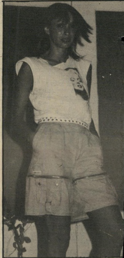
רוזיטל נרב ספונג'ה והצלפות

גלינג'גלינג. הטלפון מצלצל. מי על הקו? קוראים לי רוזיטל נרב, אני מנהלת משרד-הכריות לפניים ופגיוות. כיום ראשון אני עורכת ערב מיוחד לרווקים אולי תכתבי עליי"