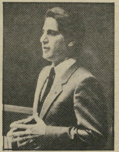
הנשיא אלי-ג'מיייל נכונות להגמיש עמדות

להשיג עבורם עמדות-כוח אמיתיות שהרי אז לא יהיו יותר תלויים בסוריה וזו תאבד את עמדת-הכוח שלה בלבנון. לפיכך, אין זה מן הנמנע, כי הסורים יגיעו להסכם כלשהו עם ג'מיייל, או עם גורמים מארוניים אחרים, מאחרי גבם של הדרוזים ובעלי-ביתם. הסורים ובעלי-ביתם המקומיים מופיעים כעת, כלפי חוץ, כחזית מלוכדת, אך אין הדבר מפריע לכל אחד מן הצדדים לתכנן כיצד ובאילו נסיבות לתקוע סכין זה בגבו של זה. ולסיכום — למעשה מתנהל העימות בלבנון בשלושה רבדים עיקריים: ברובד מקומי — הלחימה בין המישטר למתנגדיו. הרובד האיזורי — המאבק בין סוריה, התומכת במתנגדי המישטר, ובין ישראל, התומכת במישטר. קיימת אי-סמטריה בין פעילותן של סוריה וישראל. בעוד הסורים תומכים באופן פעיל במתנגדי המישטר, עיקר התמיכה הישראלית במישטר נובעת מן האיום הישראלי להתערב במידה והסורים ייכנסו לשטחים שפוגו על-ידי זה"ל, דבר המנטרל את העוצמה הצבאית הסורית ומונע ממנה להשתתף במערכה. הרובד הגלובאלי — העימות בין ארצות-הברית לברית-המועצות. גם כאן יש אי-סמטריה במידת המעורבות. בעוד שברית-המועצות תומכת בסורים מרחוק, על-ידי ייעוץ וכדומה, הרי