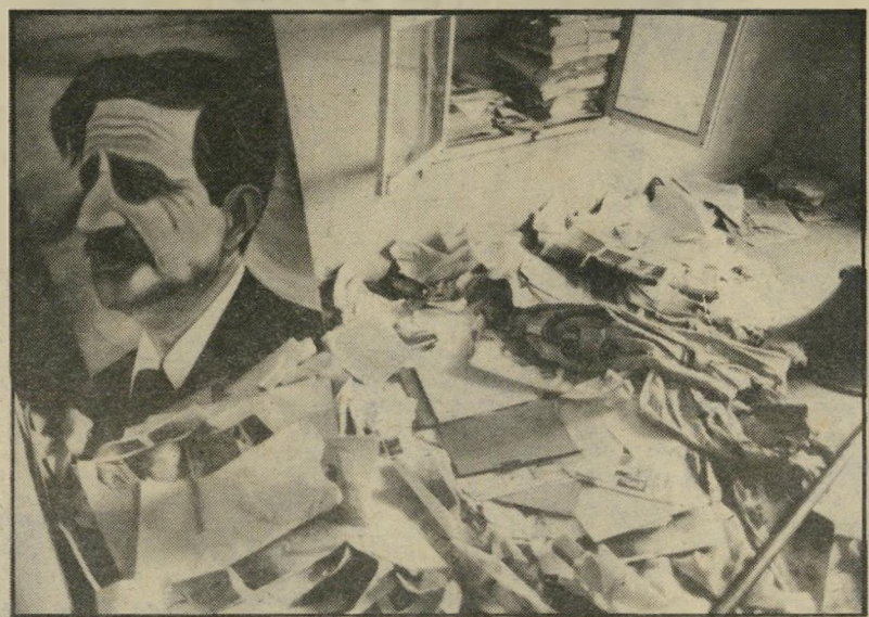
מייסד "התנועה הלאומית" במאל ג'ונבלאט כליה-הנשק נשאר במחסנים

חפיפה מושלמת בין יעדיהם של הגופים בחזית ההצלה ובין יעדיה של סוריה. יש הסכמה לדרוש את ביטול ההסכם עם ישראל אך לא תהיה זהות כמחנה זה בדרישות לגבי המישטר בלבנון ותלוות הכוח בין הערות. אין להוציא מכלל אפשרות שהמשא והמתן ילווה באש ובפעילות צבאית, על-מנת ללחוץ על מישטרו של ג'מיייל, ובעיקר על האמריקאים החוששים מהתדרדרות מעורבותם. כדי שילחצו על גמיייל לוותרים. מבחינתו של גמיייל עומדות בפניו כמה אופציות. אם יגלה גמישות, ייתכן שיצליח לתקוע טריו בין הסורים ובעלי-ביתם כדי להציל את מישטרו, מצד שני ייתכן שיעזוב עליו לחץ מצד האווליינים.