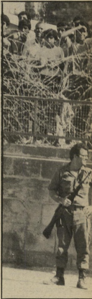
מתחנים בני ממתנינים מעבר לגדות-התיל של בניין המימשל הצבאי בצידון. עד שישוחררו קרוביהם שבאו ממחנה אל-אני צאר. לפנייהם עומד חייל ישראלי.

נראה שכולם נמצאים כמתח נורא כל הזמן. חיילים מסתובבים בכל מקום לבושים בשכפ"צים הכבדים, משטר" לים שלא לצאת כלל משטח בניין המימשל, אלא אם כן זה הרוש. חלקם לבושים בשכפ"צים אפילו בתוך חצר הכניין. המצב שונה לחלוטין ממה שהיה לפני כמה חודשים. חזרנו לבניין המימשל, לא נסענו, מכובו בדרך קיצור, אלא ברור