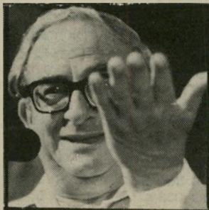
נבון והחשבון של לוי

עמדת ארבעת נציגי הליכוד היתה נוקשה. יצחק שמיר, משה ארנס, משה ניסים ורוד לוי טענו, במידה משיימת של צדק (שאינו זהה לחוכמה, שהיתה הפעם נתלתו של