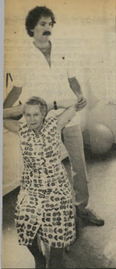
כדורסלן פיזיותראפיסט שלכטר אולפן, צבא. מישפחה, צאצאים

הוא, כאמת, ידע להשתלב: במכון לפיזיותראפיה אני נרגע, במיגרש יש לי זיעה ומכות.