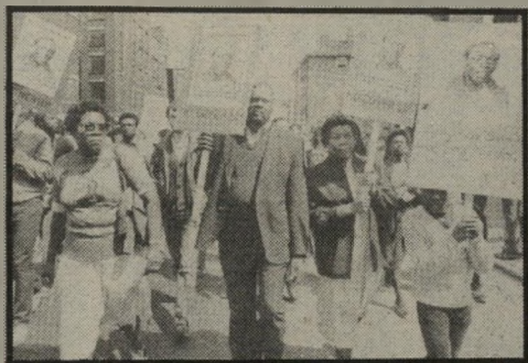
הסגנה נגד אלימות המישטרפה שילוב העניין המיני בעניין המדיני

שלושה אירועים נפרדים מתקיימים כדי להביע הודות עם צ'ילה, אליסאלבדור (הכונה להודות עם העמים, לא עם הממשלות) ועם זימבאבואה. 15 אירועים וסמינריום ייערכו עבור הפמיניסטיות, וכן הפגנת הודות עם המלסטיניים, ערב תרבות סוהילית, יום-עיון על זכויות