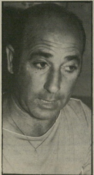
יבואן מעיין שאלות לרופאים הווטרנרים

אך הווטרנרים, שלמדו בהיותם צעירים שהמיקצוע שלהם הוא הצלת חייהם של בעלי-חיים, החליטו שיש