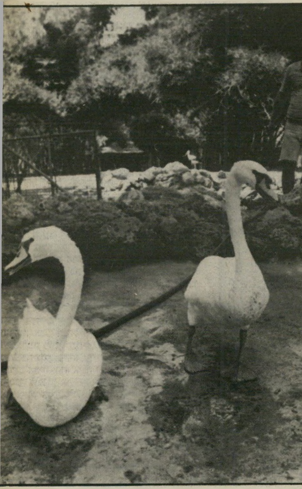
ברבורים בגבעת-חיים מהמושב לילדי הקיבוצים

מה גרם לכך שהווטרנרים החליטו לחסל ברבורים שנשלחו לארץ עם תעודת-בריאות חתומות על-ידי השרות הווטרנרי של הולנד? מרוע משמידים הווטרנרים בתחנת-ההסגר ברמלה בעלי-חיים בריאים? כתב ד"ר אקרמן למעיין, בין היתר: 16 הברבורים, שהגיעו עבורך מהיר לנד, הובאו לארץ בניגוד לחוק (ולא היתר וטרנירי). ניתנה לך אפשרות להחזירם לארץ המוצא, אבל הצהרת