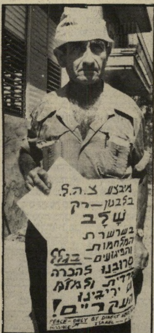
קורא זמיר ללא קווייטוד

עוד תקרית בין שרון והעיתונות. יש לברך על הסנקציות שהטילה