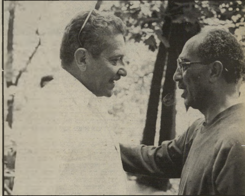
סאדאת עם וייצמן בקמפדייוויד מה זה המיליארד הזה שאנחנו מקבלים מארצות-הברית?

כן, אני חושב כך. אני סבור שאתה יכול לשפוט לפי התגובה לרצח סאדאת. מה היתה התגובה במצריה? התגובה היתה שלילית מאוד לסאדאת. זה ברור מאוד ולא צריך להתעלם מזה. אני זוכר שאמרתי לשגריר (האמריקאי)