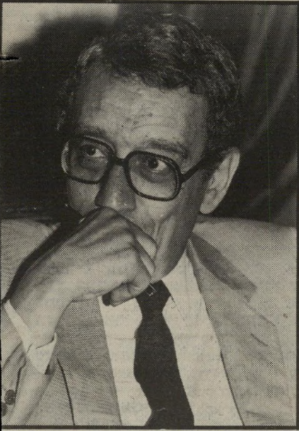
שרהמדינה בוטרס-יעאלי בחור נחמד, בלי אומץ