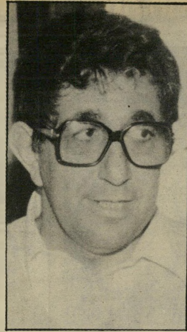
מתעשר יגור מה עשו החברים

מהם הוצאו חלק לנסיעות בחו"ל, חלק אחר, כשני שלישים, לחיסכון וחלק אחר המוערך ב־800 עד אלף מיליוני דולר, יצא אל מחוץ למערכת. המינוח "מחול" כולל שטרות והמחאות נוסעים בכספות בארץ, וכספים שהושקעו או הופקדו במסדות בנקאיים בחו"ל. המסלול הוא הפטנט הישראלי לעידוד הברחת הון: דולרים זולים בכמויות בלתי מוגבלות לכל מבקש. בספר שעריך צוות בנקאים בינלאומי בכמויות של ה.בנק של הבנקים הידוע יותר בניו-י.ב.י. ושמוקם מושבו בציריך שבשווייץ. נמצא שישראל היא אמת המדינות שעדיין מקיימת סיקרה על מטבע זר, וקל להוציא ממנה מטיח. עורכי הסקר קבעו בין השאר דגם של מדינה שבה תופעת הברחת מטבעות היא כמעט הכרחית. הם הזכירו בין השאר אירואות פוליטית ובעיקר אירואות כלכלית. הם הוכיחו שככל שגדל החוב החיצוני של מדינה, כך גדל גם דגם ההון השחור הבורח מאותה מדינה. הם תארו את בריחת הון כפונקציה של פחד, יותר מאשר של