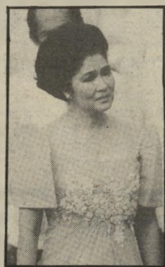
אימלדה מארכוס סמל-שחיתות

האופוזיציה מונהגת בכישרון רב עליידי סאלברור לאורל רכיביושף של מאנילה, חיימה סין, שוכה בעידוד גלוי של יפיוור בפעילותו נגד מארכוס. סין קרא, אומנם, לפעולה אלימה, אבל הסכרו למתח הרב השורר בפיליפינים לא היה וולוגי, אלא פוליטי-חברתי: "האלימות מאיימת עלינו, מכיוון מישה אחוז מכלל האוכלוסיה גורפים 30 אחוז מהרווחים. 17 מיליון בני-אדם (מתוך כ-45 מיליון) סובלים ממש מחרפת רעב". מארכוס, שהכריז על מישטר חירום צבאי ב-1972, מאשים את 'תן העולמי בכל תחלואיה של ארצו. הצמיחה הכלכלית היתה