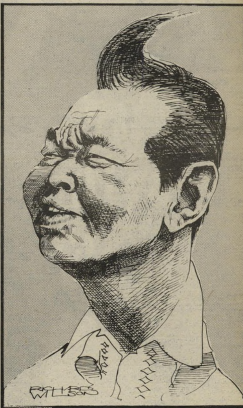
נשיא מארכוס שומר-ראש מישראל

כוחם המיספרי של חיילי בא העממי החדש אינו מרשים תר. התנונים מצביעים על 50 לוחמים בלבד. עם זאת, הפעם הפוליטי-מורטית זה מאוד. מומחים לענייני