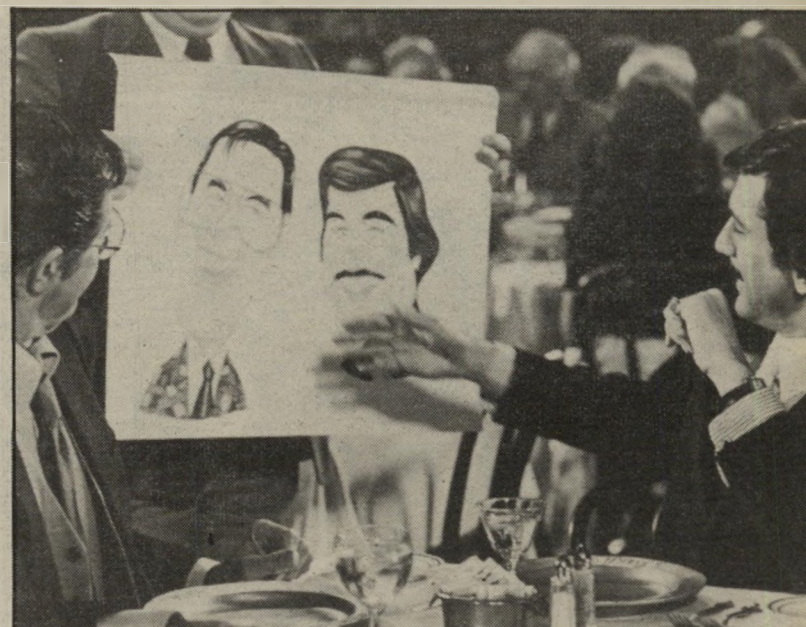
דהנירו ולואיס מתבוננים בדהנירו ולואיס ב"מלך הקומדיה" מלכי הצחוק והדמע