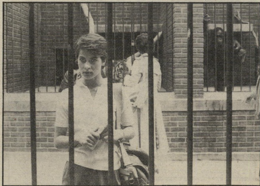
3. קללת אנשי החתול (ארצות-הברית)