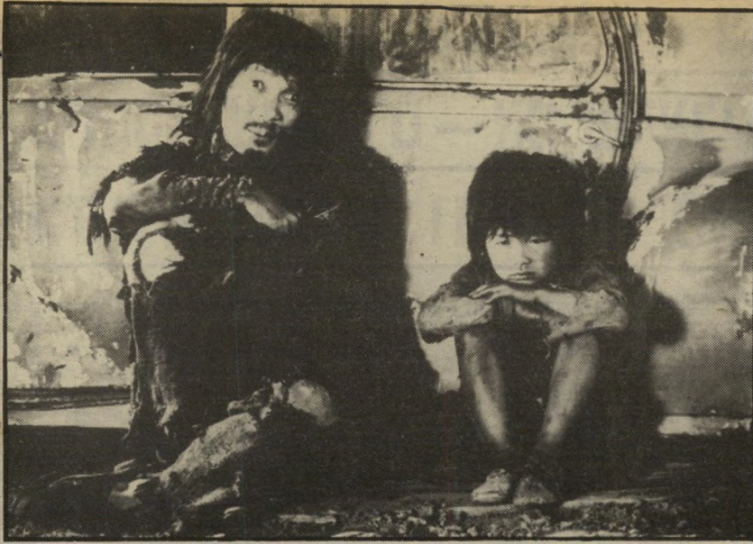
2. דודסקאדן (יפאן)