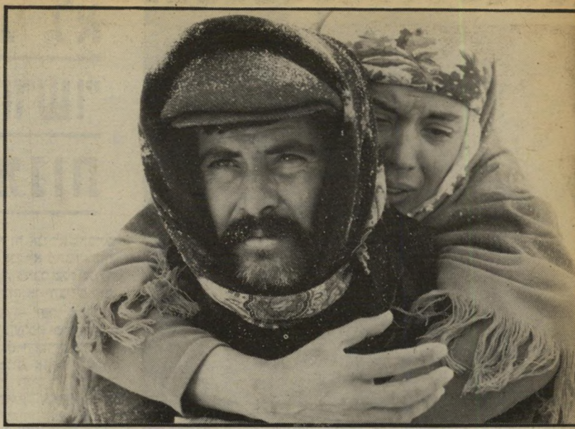
1. יול (תורכיה)