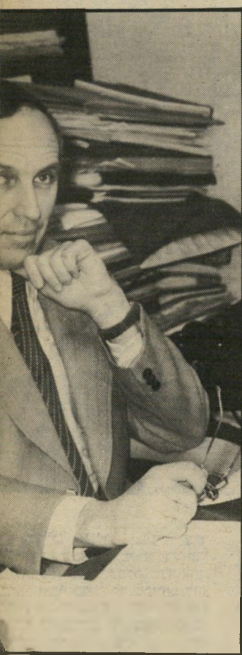
י"ד הבורסה ד"ר חת הבנקאיות ימשיכו לעלות

הבנקים בצרות. גם המאזנים שלהם. כי שעבר ניהלתי ויכוח, כמה הפסידו הב נשמונת החודשים האחרונים בבורסה. לדעת, אבל זה הרבה. מישו אמר שזה במח 800 מ דולר. אני טענתי, שגם הצי מסכנו — זה המון. ב.בנקישראל אימ לא מוכנים להתייחס. אבל, הם אומ הסכומים מוגזמים.