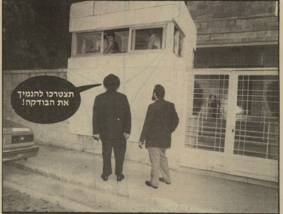
סוכת השומר לפני בית ראש-הממשלה