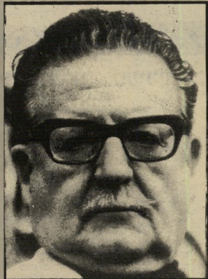
סאלבור איינדה הומניסט, סוציאליסט, דמוקרט

אין טעם לדווח שוב על הפרשה הזאת, שהועלתה עשרות פעמים במדרו הזה. אפשר רק להתאבל, יחד עם כל קוראי העולם הזה, על רופאיהדילרים