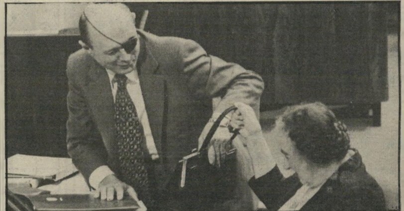
גולדה וריין (מגישה לה את הארנק) בכנסת ברברן ופרימיטיבית

ישב משה ריין אי-פעם על תקן של אליל. כיום ברור לחלוטין שהוא היה ברברן, מתחכם זול, שמעולם לא אמר אך מילה אחת שהיו בה טעם ותבונה. בסך הכל נראה ריין כיום כאיש עלוב. פרימיטיבית ומטופשת, שחזרה בלי הרף על כמה פסוקים אינפנטיליים כלשון משוכשת. גם יגאל אלון נראה, במבט לאחור, כאדם רדוד וחסר-משקל. מי העז לאמר ב-1970 שמשעה ריין הוא אפס מנופוז שגולדה מאיר היא אשה פרימיטיבית? רק עיתון אחד במדינה: העולם הזה. ורק סיעה אחת בכנסת: זו שלנו. ועל כך שנאו אותנו, השמיצו אותנו, רדפו אותנו והחרימו אותנו. איך זה מתבטא בכתבה יוק. אין. עלידי גניזת חלק זה של ההווי שבין שתי המלחמות, הופכת אמת לשקר. מצטיירת תמונה נוחה: כולם טעו, כולם שגו. לא היה מי שהוהיר. אי-אפשר היה לדעת. כולנו הופתענו. הטלוויזיה עצמה, שקמה אחרי מלחמת ששת-הימים, מה היא עשתה כדי למנוע את האסון? כדי להזהיר ולהתריע? או, לפחות, כדי לאפשר למוזריים ולמתריעים להשמיע את דבריהם?