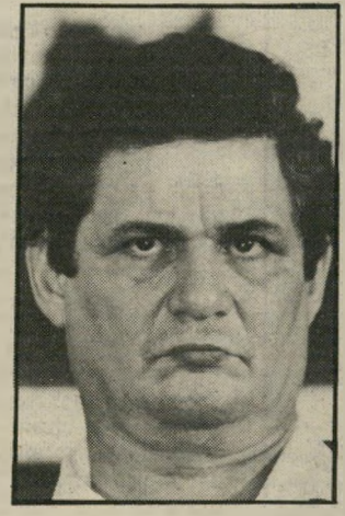
מתמודד ארידור פחות מעשרה