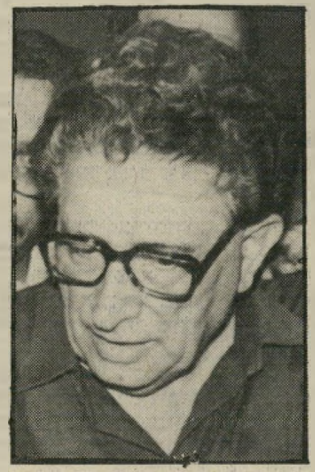
מתמודד קרמר ותיקים וירושלמים