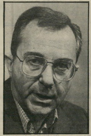
מתמודד ארנס החמצה זמנית

ש ש שנים התנהלה המילחמה כמעמקי הארמה. מאז עלה ה' ליכוד לשלטון לא העז איש להודות בכך, שיורשיו של מנחם בגין מתאר גנים במחנות, וממתינים לדגע שבו הוא יעלם ממרכז הבמה הפוליטית. מהיום שבו הודיע בגין על כוונתו להתפטר, חדלו היורשים להסתתר. הקרב מתנהל כבר על פני האדמה. הבחירות, שבהן היו צריכים חברי מרכז חרות לבחור מועמד חדש ל' ראשות־הממשלה, מנעו את קיום המאבק האמיתי. אך עתה נפרצו כל הסכרים. למרות שמרכז חרות בחר