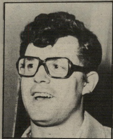
שומרי עמית טוב בלי ויליאמס

מעריך שלא יהיה שינוי משמעותי ביחסי הכוחות. נראה לי, שאולי כבר גילערי תעלה בכמה נקודות, ואילו גליל-עליון תילחם על המקום השלישי או הרביעי. מוקדם עדיין להעריך. גם מישחקי המיבחן, שהיו עד עתה, לא מהווים קנה-מידה. אני בטוח שכל הקבוצות ייצטרכו השנה, מנה גרושה של אורדרו עם נשימה ארוכה מתמיד."