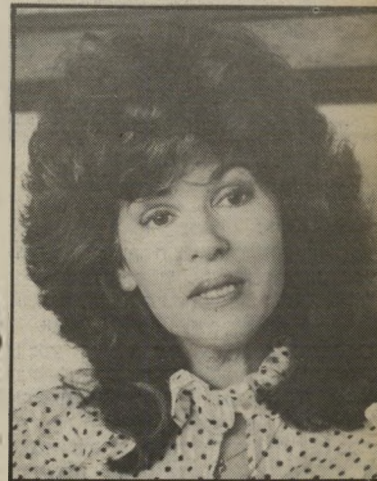
אוסירה נבון להשתקס

לא היה כימעט עיתונאי שלא טיפס על הגברת דפירה. כל צעד מצדדיה, כל אמירה שבפיה, כל