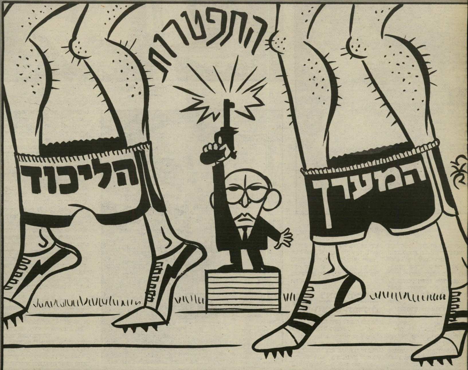
זאב פרקש (זאב): בגין השאיר את כולם עם המכוסיים למטה

הצילום יותר מרזיק ויותר אמין. או חיפש ציור בעיתונות ררך חרשה — ומצא את מקומו קריקטורה, שאינה תיאור ויואליאובייקטיבי,