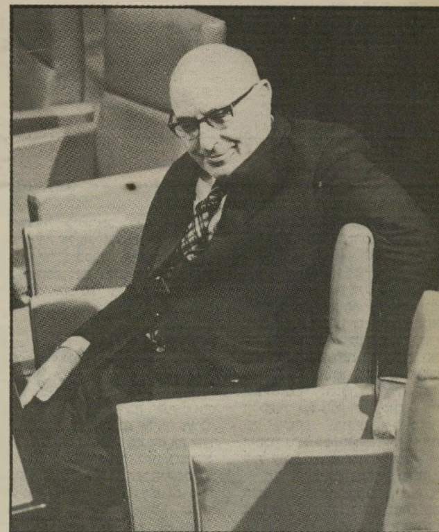
ממליך ספור הפטרון טיפח צעירים