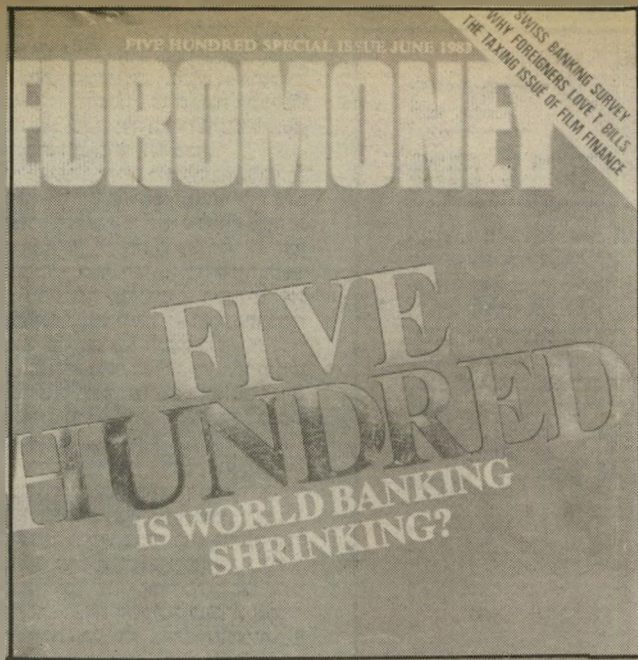
שער הירחון המדרג הישראליים טיפסו לצמרת

שני הבנקים הישראליים תפסו להם מקום מכובד בצמרת הבנקאות