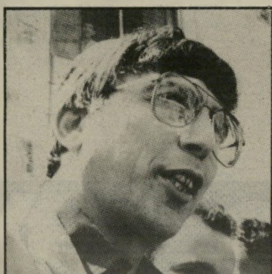
אהרון אבו-חצירא: מאסר בפועל

מאחר שכך נתמצו הערכאות המישפטיות, אין עוד אפשרות לטעון כי השר לשעבר הוא הן-משפט.