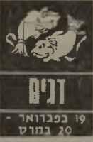
דגים 19 בפברואר - 20 במרץ

השנה ימשיכו בני מזל דגים להנות מהדרך החדשה שבה התחילו. ידידים ישנים ייכנסו מחדש למעגל החיים, והקשרים המחודשים יסיפו טעם טוב. רצון לדחות נסיעות לחו"ל עד כמה שאפשר, שכן ב"נסיעות אלה צפויות בעיות. בני דגים עלולים לאבד את רכושם או שסכסכמים ייגב. תוכניות שקשורות לחו"ל יצליחו להתבצע רק לאחר קשיים ועיכובים. לטסודנטים בני המזל לא יהיה קל. הם יצטרכו להשקיע מאמצים.