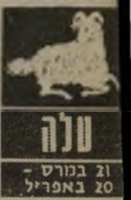
טלה 21 במרץ - 20 באפריל

נובמבר ייווצר מצב חדש בכוכבים - פלוטו עוזב את מזל מאזניים אחרי שנה כמאת-עשרה שנה, ונכנס למזל דרב. תזוזה זו מעוררת חששות בלב גסטרוולוגים. יתכן שהיא תגרום החמרה במצבנו הכלכלי. מנובמבר שוב נהיה נוטים לגזירות כלכליות חדשות, ונאלץ להתחיל להדק את החגורה. מבחינה בטחונית נדע שוב קשיים וזרזים מאי, יוני ויולי, כוכב המילחמות, מרס (מאדים), יהיה בנסיגה, ויאיים עלינו מתיחות נוספת באזור הצפון. נקווה בעבור חודשים אלה ללא מילחמה, אם כי מצב הכוכבים אי-אפשר להבטיח זאת. ומה צמיו לכל אחד מאיתנו בשנת תשמ"ד? עלינו המזל שאלו הוא משייך.