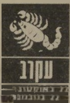
נקרב 22 באוקטובר - 22 בנובמבר

סרטנים יצטרכו להיות זהירים בכל מה שקשור לכספים. השנה אסור להם לקחת סיכונים. כל דבר שנושא אופי של הימור או מזל עלול לגרום הפסדים. רק על בטוח, ולתכנן היטב כל צעד שהם עומדים לעשות. סרטנים רווקים יוכלו למצוא לעצמם בני או בנות זוג, ועד סוף השנה הם עשויים למצוא עצמם נשואים. הנשואים יוכלו להנות מאהבה מחודשת ומיחסים משופרים עם בנייהוג.