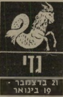
גדי 21 בדצמבר - 19 בינואר

המזל ששנה זו תאיר לו פנים הוא מזל גדי. הגדיים שאינם רגילים לפינוק, יזכו לו השנה. ויעזרו להם לקדם כל דבר שבו הם מעוניינים. במקום העבודה הם יהיו מקובלים ויזכו להערכה של אלה הבאים עימם במגע. מבחינה רומנטית זו השנה שבה הם ימצאו אהבה רצינית ועם הקשר החדש יוכלו להגיע אפילו לנישואין. גדיים יוכלו לשפץ את דירתם או לעבור דירה. בעלי עסקים יוכלו להרחיבם.