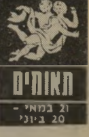
תאומים 21 במאי - 20 ביוני

בני תאומים יעברו שינויים משמעותיים השנה - השטח הבולט יהיה קשור לעבודה. כאן יהיו עיקר השינויים. חלק גדול מבני המזל יחלמו את מקום עבודתם, וייתייחסו ל"מקומם החדש ביתר רצינות ונכונות. גישתם החדשה לעבודה ת"מיח את מכריהם, אולם שינוי זה לא יהיה בן יום - הם יפירושו עומדים להשתנות. מבחינה בריאותית יצטרכו בני המזל להשיג על עצמם, לשמור על כוחם ובריאות גופם.