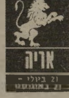
אריה 21 ביולי - 20 באוגוסט

לאריות צפויה שנה לא קלה. התחום הקשה יהיה קשור לבית ולמישפחה. מתיחויות, סיכסוכים וחשבונות עם בן-הזוג, יביאו לחריס שקט ולהתלבטויות רציניות. קשה יהיה למצוא פתרון למצב זה, אך חלק מבני המזל יאלצו להחליט לאיזה כיוון הם מעוניינים לפעצמם ימצאו את עצמם מובלים על-ידי ה"גורל עצמו. וזה לעתים קרובות פחות נעים. מקום המגורים עלול להוות בעיה נוספת.