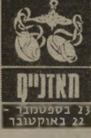
תאנים 23 בספטמבר - 22 באוקטובר

בשנואה לשנים שחלפו, תהיה השנה קלה יותר וטובה יותר. אחד התחומים שיהיה חשוב במיוחד קשור למגורים. בני מאזניים ירצו לעבור מחמקום שבו הם גרים לאזור יותר נוח וסימפטי. החל בחודש ינואר הם יוכלו להגשים את מאווייהם. אלה שמחפשים דירה יוכלו למצוא את מה שהם מבקשים, והדבר יסתייע על הצד הטוב ביותר. מבחינה כספית בני מזל מאזניים יהיו לחוצים מאוד אך יתאוששו.