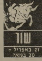
שור 21 באפריל - 20 במאי

לשוורים לא יהיה קל בשנת תשמ"ד. מועקת שקשה להבין את מקורה תקשה עליהם. תגורם להם להיות איטיים מתמיד. המרץ שאיפיון את השנים ה"אחרונות, יעלם. הם יצטרכו לגייס יותר כוחות כדי למלא את תפקידיהם. השטח הקשה יהיה התחום שבינו לבניהם - אי-הבנות, התרגויות ו"אכזבות יהיו מנת חלקם השנה, אולם אפשר יהיה למנוע אותם על-ידי יותר התחומים המבטיחים יהיו קשורים בלימוד ובנסיעות.