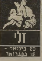
דלי 20 בינואר - 18 בפברואר

לבני מזל דלי, שנת תשמ"ד לא תהיה קלה. מצב-הרוח הקודר שבו הם נתונים, ילווה אותם גם השנה. בתחום הקאריירה הם יתקלו בקשיים, שאותם לא צפו מראש. את התוכנית שהכינו לעצמם ו"יצליחו להגשים. אנשים שאותם חשבו לידידיהם הם יעמדו בדרכם ו"יעכבו את התקדמותם. בחוג המינימלי הם לא ירגישו בנוח. שכן הבית ילחץ עליהם, והם ינסו למצוא לעצמם מקום אחר להרגע בו.