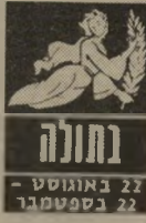
נתולה 22 באוגוסט - 22 בספטמבר