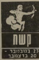
קשת 23 בנובמבר - 20 בדצמבר

לקשתים מצפה שנה די מוזרה. מצד אחד הם יהנו ממצב כספי משיבוע רצון, אלת המזל שעוזרת להם בדרך-כלל, תהיה נדיבה במיוחד. הרוח של הקשתים לא תהיה מן הטובים ביותר, מועקות ודכאוניות יפקדו אותם לעתים ופתרון לכך לא יימצא במהרה. השנה יהיה עליהם להתחשב יותר בבני זוגם, מכיוון שהתנהגות חסרת התחשבות תביא לתוצאות לא רצויות. לרווקים בני קשת מצפות הפתעות בתחום הרומנטי.