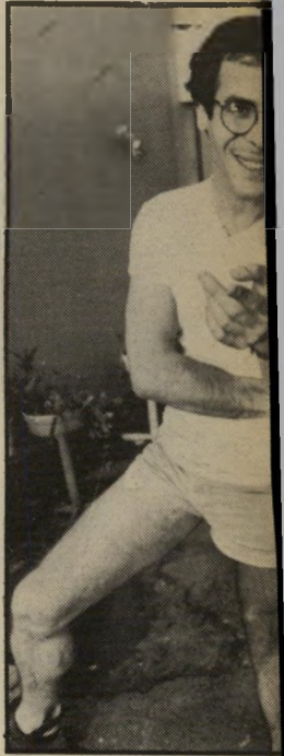
שליו בבית אולמות מלאים