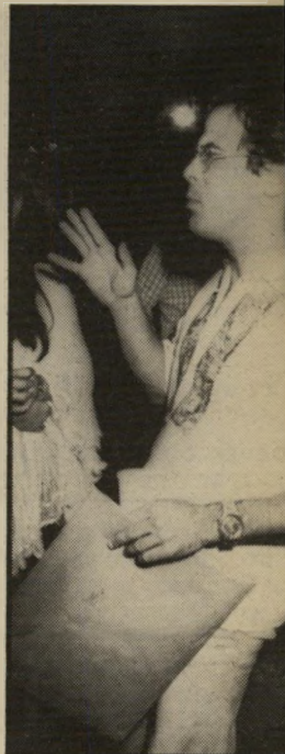
שליו בפעולה צחוקים אדירים

א גיד לך את האמת, אם את בבקשה. אבל העניין הזה עם מאיר שלו, שנולד בנהלל, אשתו הדיילת ובתו המוכשרת, כבר נמאס ממש. כל פעם שאני הולך לעשות דבר חדש באיזה עיתונאי ורוצה לשמוע איך אני מסתדר עם הילדה כשאשתי בטיסות. טוב, אז סיפרתי וסיפרתי וכתבו ופירסמו. די! נקעה נפשי מהשטויות האלה. למה זה מעניין את כולם אם אני מוריד את הזבל בבית או עושה ארוחתצהריים? הרי אני כסר'הכל פרצוף בטלוויזיה ואני אף פעם לא שוכח את זה. מאיר שלו גר בכיתאבן ירושלמי, מרווח ויפה, כמושבה הגרמנית. בבית ריהוט-עץ חום, הרבה עציצים שופעי ירק ואויר-הרים צלול כיון, הנכנס מן החלונות הגדולים. ניכר בבית שבעליו אוהבים אותו. מאיר שלו גאה במיוחד בחוריהעבודה הקטן ועמוס הספרים. זו הפעם היחידה בחיים שיש לי חדר משלי.