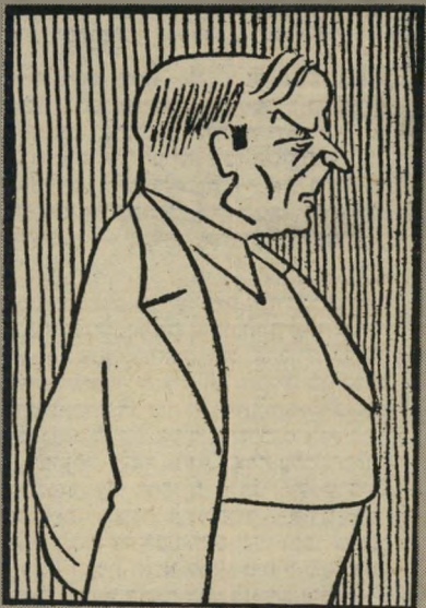
סופר-משורר המאירי לעזוב את הארץ

לאן? — אין לי מושג. — אך להשאיר מה — אי אפשר. כן, אפשר בתנאי אחד: להיות נבל, קצת המדה, הסינים של שני האולמים שלנו