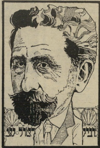
סופר-עורך בוצ'ין העורך הספרותי הראשון

קודם לעלייתו של י"ח ברנר ארצה, ישבו בארץ כמה סופרים, שאף פירסמו לעיתים יצירות ספרות. אך לא התקיימו בארץ חיים ספרותיים. לא היתה פעילות מ"לית חילונית סדירה, לא הופיעו כתבי-עת ספרותיים באופן רצוף וסדיר,