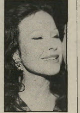
עיתונאית יריב פאלנגות ופלסטטינים