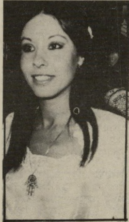
זמרת ארזי כובעי פלדה

● הרב מנחם הכהן: עכשיו יש לו לאריק שתי חוות.