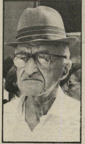
פרופסור לייבוויץ רוח ובורסה

העיתונאי שלום רוזנפלד: למחרת הפורגרום במחנות הפליטים בניירות, כאשר ניצבתי, כמדי בוקר, לגילוח לפני ראשי, ירקותי כפרצופי. ראשיהממשלה מני חם בגין: גויים הורגים גויים ואותנו צריך לתלות? המחזאי יהושע סרי בול: בגין ואריק — צאו אנשי הדמים! הפרופסור אניטה שפירא: תיחשף האמת והצדק ייראה וייעשה — אז אולי נוכל שוב לשאת את עינינו זה אל זה.