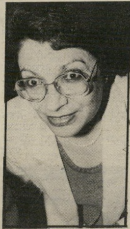
סגנית-שר תעסה התפרקות מסוימת