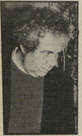
עיתונאי קינן סיכויים והחלטות

המשורר יב"י: כשה אנוש והאנושי משחקים במחבואים, והבורסה, הכדורגל