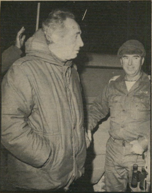
איתן (עם פרס): מן הגילוס ער הפרת

יש הסבורים כי מנחם בגין לא ירחיב את ישראל מעבר לגבולות "ארץ ישראל ההיסטורית", מפאת רבקותו באידיאלוגיה של תנועתו. בניגוד לדודי בן-גוריון, שלא הכיר