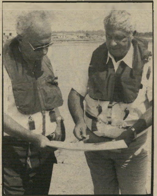
שרון (עם רבין): גם תחת דגל קומוניסטי

ההרפתקה של אריאל שרון, איש-השנה תשמ"א ותשמ"ב, בלבנון, תוכננה כולה עוד 28 שנים לפני כן על-ידי דודי בן-גוריון, כפי שרשם משה שרת בקפדנות ביומנו הסודי. רק מיגבלות-הכוח נקעו בעד צה"ל ב-1948 לכבוש את הגדה המערבית. התוכניות של יצחק שדה ואחרים, שתיכננו או מיבצע