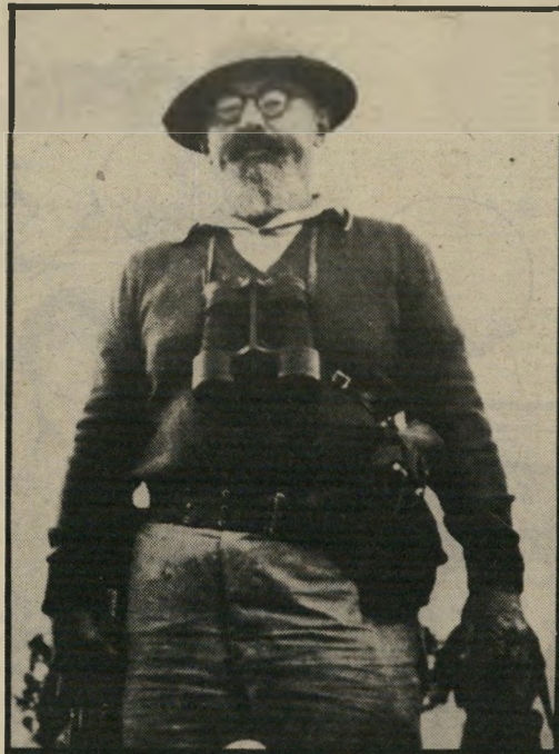
יצחק שדה: כיבוש הנדה המערבית

מאז כבשה ישראל את הגדה המערבית ורצועת עזה, סיני וגולן ויותר משליש לבנון. היא התקרמה, נסוגה והתקרמה שוב. היא כבשה את סיני פעמיים, ופינתה אותו פעמיים. היא כבשה חלק מן הגולן, ולאחר מכן חלק שני, שאותו החזירה. היא כבשה את רצועת עזה פעמיים, והחזירה אותה פעם אחת. היא כבשה את הגדה המערבית פעם אחת, ומחויקה בה.