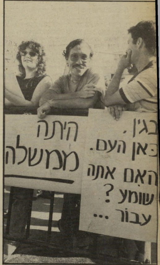
אנשי-סילואים מפנינים לפני בית בגין

שה להאמין כי מנחם בגין הורעוע יתר על המידה מעצם הוועה. הוא עצמו הפיץ את הגירסה הצניית שנוצרים הרגו מוסלמים, והעולם מאשים את היהודים.