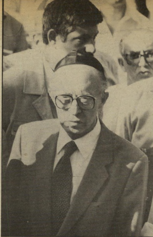
ניתוק: בגין בהלווייתו של שימחה ארליך

כי שלון בלבנון התווסף לכישלונות אחרים, שהיו קשורים בו במידה רבה. הכלכלה הנכונה של יורם ארידור התמוטטה, והממשלה מצאה את עצמה בסוף השנה במערכה נואשת להציל את המשק, כשכל אחד משריה מנסה להטיל את המעמסה על האחרים, ולצאת נשכר מן ההתגוששות. כאמצע תחרות-ההיאבקות הזאת עמד מנחם בגין, כשופט אדיש, שכל המתאבקים פונים אליו לשווא. יתכן כי בגין הישווה בליבו את ארידור לשרון.