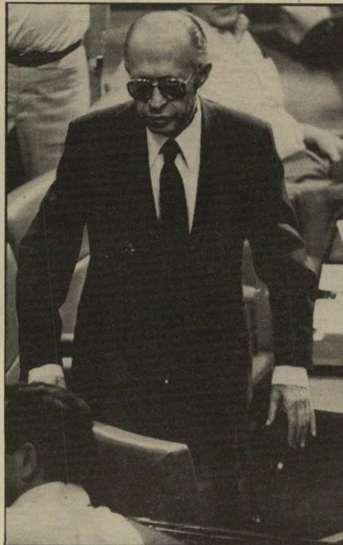
בגין בכנסת ועם בנו בני בגין (למטה)