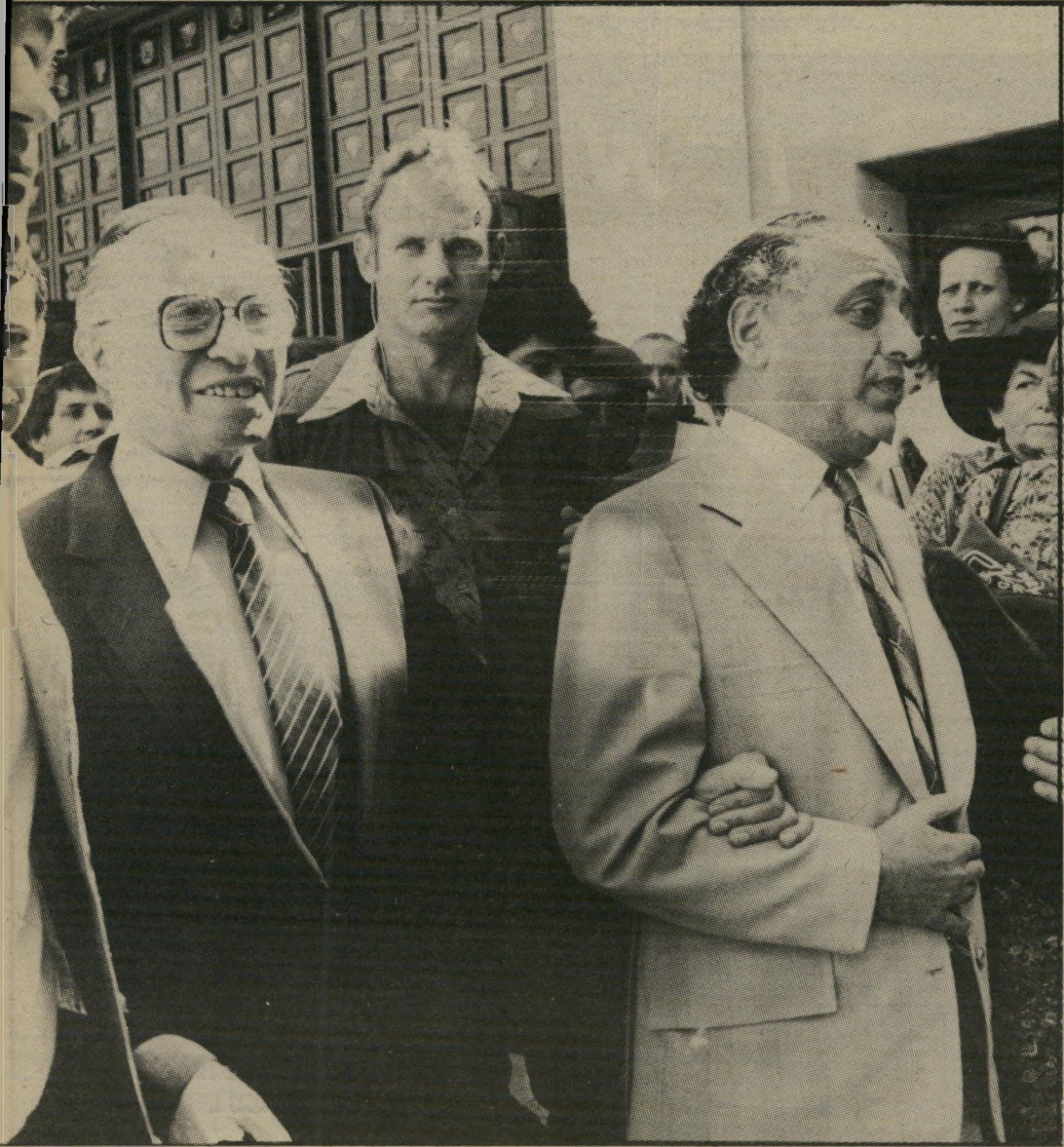
חיוך מסויים: בגין בצאתו מבית-הכנסת. ביום השני של ראש-השנה תשמ"ג

בשיא יוקרתו, לא הגיע דויד כנגוריון לשילטון-יחיד כזה. אף