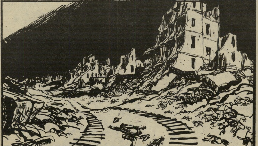
ישראל אחרי שאחילא: קאריקטורה בעיתונות האמריקאית

בארץ אירגנה שלום עכשיו מדי פעם הפגנות מחאה נגד פעולות דיכוי והתנחלויות בשטחים הכבושים. כמו בשכם ובחברון. היו אלה פעולות חיוביות ונחוצות, אך מכיוון שהמערך לא התלהב הן, נשארו רלות. ואילו הפגנה גדולה בכיכר מלכישאול בתל-אביב, במלאת שנה למילחמה, הפכה שוב למיפגן מיפגעי של המערך, תוך חרמת כל מי שאינו נוח לו.