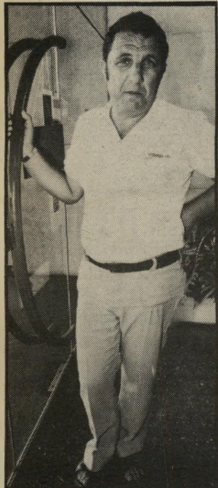
קצין-ביטחון אקרמן הישרים וההגונים משלמים

● יקראם לא גונבים". מלכר הפסדים של מיליוני שקלים, מחזיק המשביר עשרות אנשי-ביטחון, והאנ- השרים הישרים והתגונים משלמים את הצרף במחיר המוצרים. צרה לא פחות גדולה היא מכת הצ'קים ללא כיסוי. אנשים מנצלים את הפער שבחבר המוצרים. וישיי אחרי הצהריים, ואין אפשרות לברוק את מצינת הצ'קים ואת הכסוי בכנק. בכנקי שלנו ננצרת הם מנצלים לשם כך גם את השבת. אגב, ערבים כמעט שאינם גונבים שם בחנות. המכה הזאת לא תיפסק עד שלא