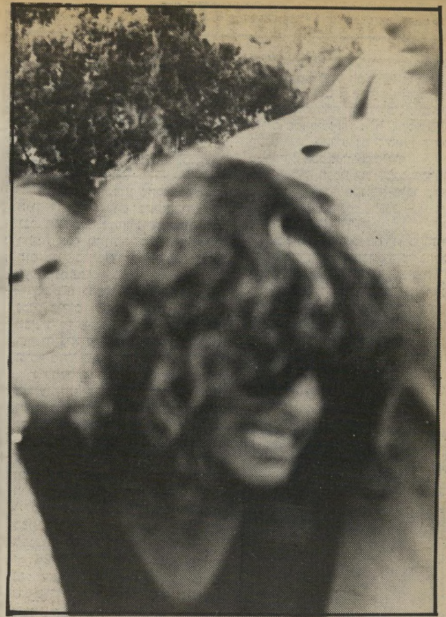
זעקת בת רותי, נתנה ביטוי ליגונה בבכי עז. שהידהד ברחבי בית-הקברות. גדוש קרובי מיסמחה וידידים - אותם ששמרו אמונים.

אף אחד לא עקר הרים כשבילו ואבא לא ידע להילחם את מלחמתו בעצמו. אנתנו מודות למעטים שהיו איתו בשנים האחרונות.