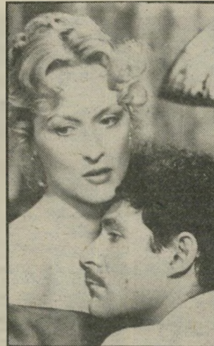
שחקנית סטרים כלת-הפרס

נפטרה ♦ בגיל 94, מאיר שלי, יליד רוסיה, קצין צבא התורכי