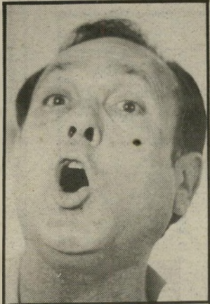
מועמד מודעי נצחון בממשלה

הוא שר-האוצר יורם ארידור. בהתקרב הימים הנוראים נראה, כי ימיו במישרתו הם ספורים. אך את מחיר הפסטיבול של השנתיים שעברו נשלם עוד זמן רב אחרי שיתפטר.