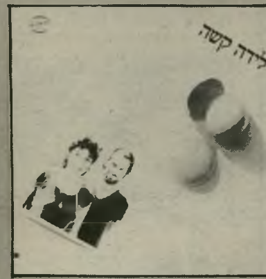
וסינגנו. מי שניחן במעט רגישות, שיוסיף תקליט חדש-יחיד זה לאוסיף זאפה שלו.

האיש מאוטופיה — פראנק זאפה; סי-בי-אס. מדי שבוע מספר מבקרי-מוסיקה מסיימים לקוראיו על מצב קיבתו העדינה: להקה איקס "עוררה אצלי בחילה" ולמראה אמן אחר "הרגשתי חום נעים מתפשט כאברי המתעוררים". אותו מבקר קבע כי השתעמם מחזרתו של זאפה על עצמו. פעם זה השפיע עליו, אך היום קיבתו אומרת לו כי זאפה הפך עקר. האמת היא כי זאפה, בגבולות הסגנון שיצר כשעתו, ממשיך להפתיע כל פעם מחדש, במקוריות מהממת. שפע של רעיונות ותקליטים מוסיפים להרחיב ולהעמיק את הסאטירה והביקורת שהוא מותח. נכון, צריך להיות רגיש כדי להעריך את מסרו