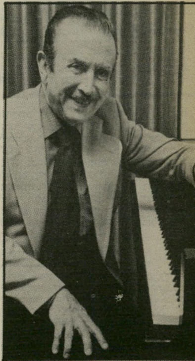
ספנתרן קלאודיו אראו מוסיקה ברמת מודעות גבוהה

כל הצעת ניסויים שלו נדחתה, היפוש אחר שותפה לחייו אימלל אותו במשך שנים רבות. האיש הדתי, לא יכול היה למצוא פורקן לתשוקת שפיעמו בו. 28 שנות חייו האחרונות בשנת 1891 הוענק לו תואר דוקטור כבוד לפילוסופיה מטעם אוניברסיטת וינה. אישור הכרה זה החמיא והרגיע את המלחין, אשר נלחם שנים ארוכות בקהל אישי ובמבקרים עוינים. את ההצגה הקצרה של המלחין אנטון ברוקנר אני מביא, בעיקר כשל הקלטה מעולה של